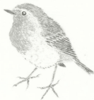
Petirrojo ( Eritacus rubecula )