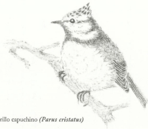
Herrerillo capuchino ( Parus cristatus )