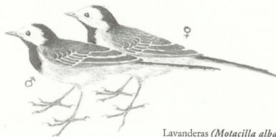
Lavanderas ( Motacilla alba )